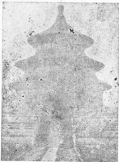
KLENTENG LANGIT DI PEIPING. Tempat Keizer-keizer bikin sembahjang.

dja'an pada Langit (Thian) sabagi wakil dari samoea pendoedoek negri. Kapan negri kelanggar bintjana heibat, boekan laen dari Keizer sendiri jang haroes dianggep berdosa, dan menoeroet adat kabiasa'an kapan rahajat di serang bahaja lapar atawa bintjana alam jang heibat, Keizer laloe kaloearken maloemat dalem mana ia persalahkan dirinja sendiri jang soedan berlakoe koerang bener hingga negri dan rahajat ketimpah moerka dari Thian. Djadinja, menoeroet systeem dan anggapan koeno. kadoedoekan keizer-keizer di Tiongkok ada merangkep djoega parkerdja'an Radja Agama atawa Pendita Paling Besar dari seloeroeh karadja'an, dan ia sendiri sadja jang djadi alat perhoeboengan antara Thian (Langit) dengan sekalian rahajatnja.